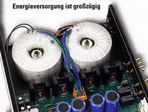
Je ein selektiertes MOS-FET-Pärchen pro Kanal sorgt für Leistung am Lautsprecherausgang, die Energieversorgung ist großzügig

Vertrieb: Audium/Visionik Tel.: 030/6134740 www.atoll-electronique.de