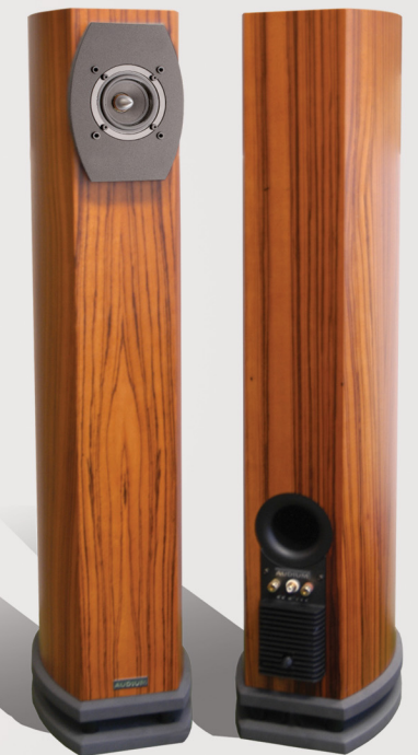
Comp 7 Drive